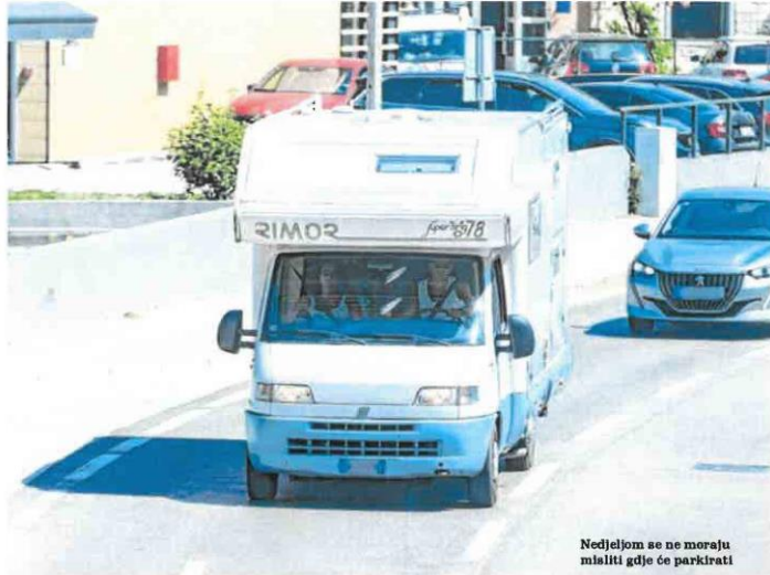
Nedjeljom se ne moraju misliti gdje će parkirati

zelenog svjetla za njegov smjer kretanja, neprikladno brzom iz Ulice Put Murvice skretao u lijevo u Ulicu dr. Franje Tuđmana, a da se prethodno nije uvjerio da tu radnju može obaviti bez opasnosti za druge sudionike u prometu te prilikom do obilježnog pješakačkog prijelaza, nije se zaustavio i propustio pješakinju koja je već stupila na pješakački prijelaz za vrijeme trajanja zelenog svjetla za pješake, uslijed čega vozilom udara u pješakinju, 73-godišnju hrvatsku državljaniku. Zbog zadobivenih ozljeda pješakinja je prevezena u zadarsku bolnicu, gdje je utvrđeno da je teže ozlijeđena. Protiv 39-godišnjeg vozača policija podnosi kaznenu prijavu zbog sumnje da je počino kazneno djelo Izazivanje prometne nesreće u cestovnom prometu. (db)