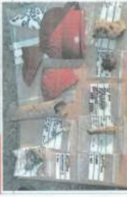
Na nalazima su pronađeni ostaci kostija morskoga psa kao i brojne kamnoseke, što je odličan znak na novim lužničkim nalazima. Ispostalo da dobara novčanih plodova i unistražnjati.

BAŠTINA Počelo snimanje dokumentarno-igranog filma o žrtvama života: