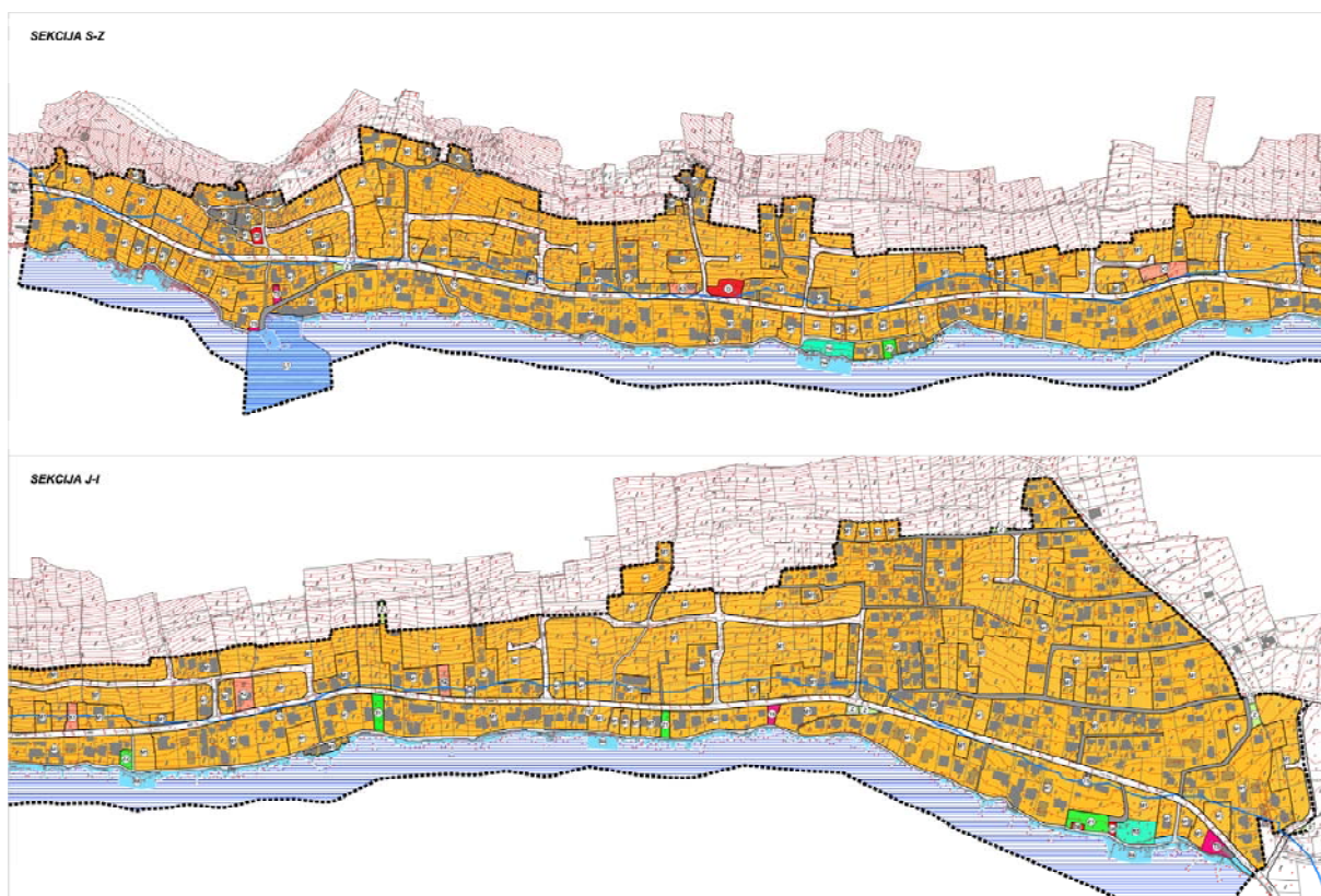
Kartografski prikaz: 1. Korištenje i namjena površina